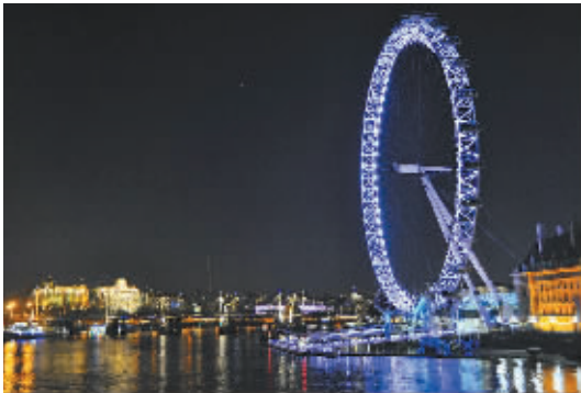
伦敦眼摩天轮。

离开白金汉宫，决定乘车前往大英博物馆，去感受世界文化的集合，顺便寻找古老中国遗失的时代印记。