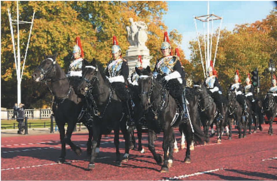
伦敦白金汉宫外准备换岗的皇家卫队。