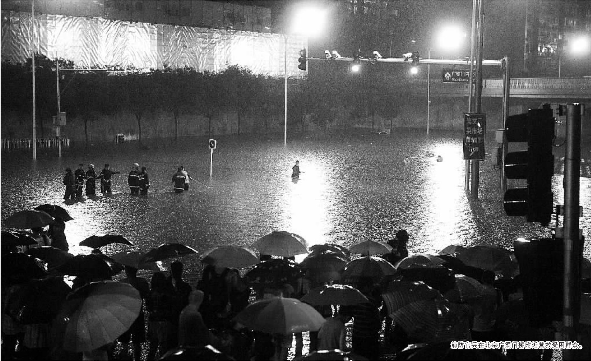
消防官兵在北京广渠门桥附近营救受困群众。