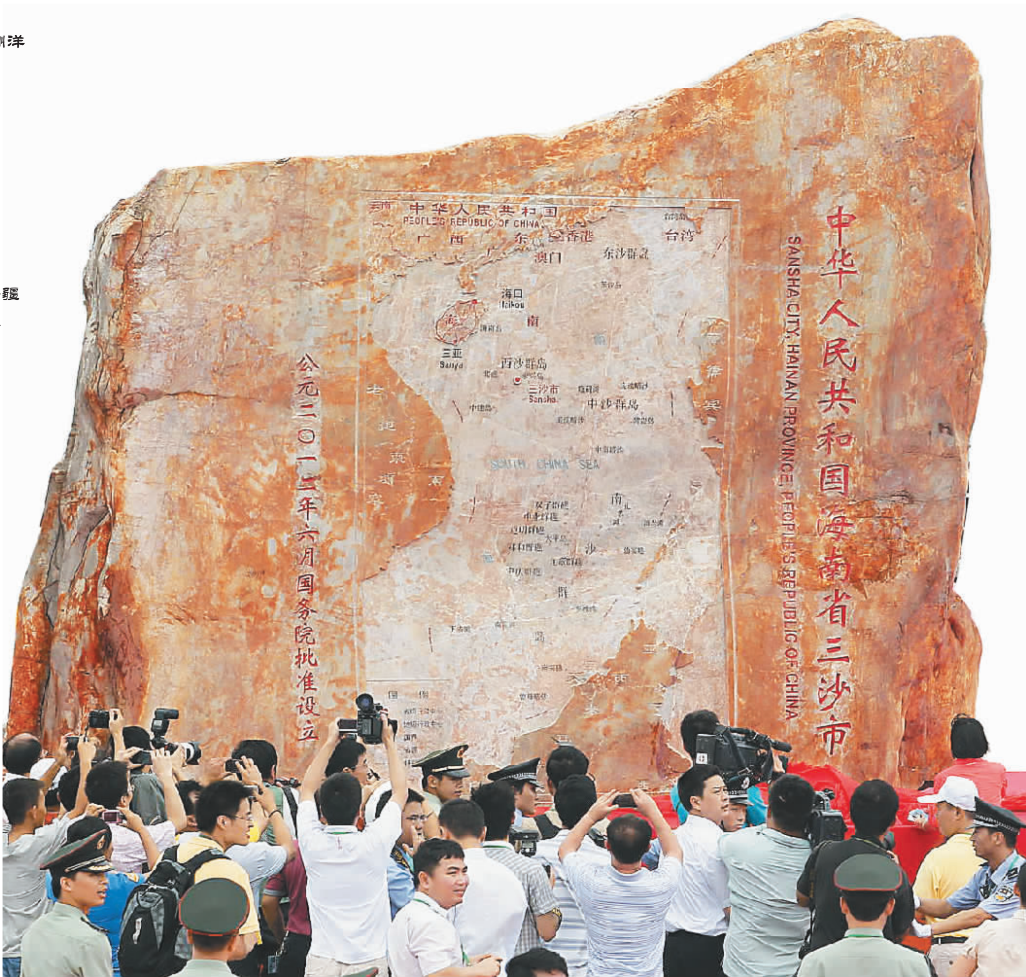
▲三沙市地名碑。