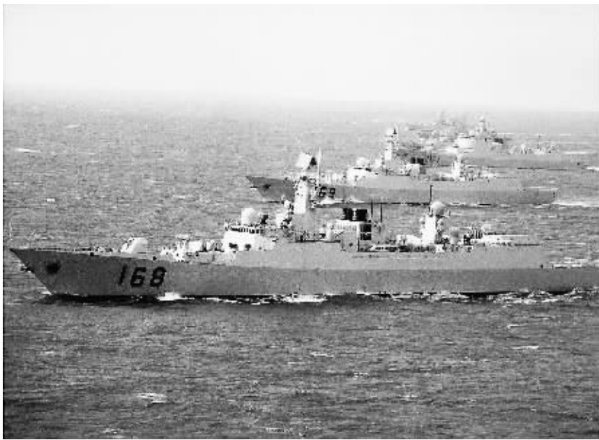
国产战舰驰骋大洋 (资料照片)

10年前,“青岛”号驱逐舰作为国产第二代主力战舰,与“太仓”号综合补给舰组成舰艇编队,横跨三大洋,航程3.3万海里,完成人民海军首次环球航行。