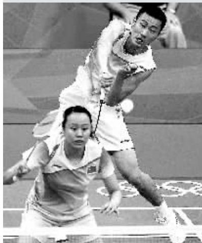
北京时间8月3日晚,在伦敦奥运会羽毛球混双决赛中,头号种子张楠/赵芸蕾以2:0战胜队友徐晨/马晋,夺得冠军。这是中国军团收获的20枚金牌。图为张楠/赵芸蕾在比赛中。

张继科伦敦时间2日下午以4:1击败前奥运银牌得主王皓夺得冠军,这名24岁的青岛籍国手以14个月的惊人速度完成世乒赛、世界杯、奥运会的“全垒打”,创造世界男乒历史上成就“大满贯”的最快纪录。夺冠后,张继科亲吻了最高的领奖台,然后以百米冲刺的速度回到比赛场地。