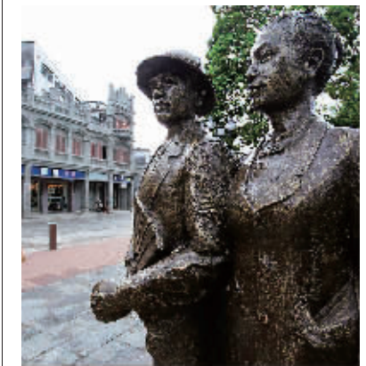
↑文昌市文南老街上的铜像还原了同乡宗亲衣锦还乡、荣归故里的场景。