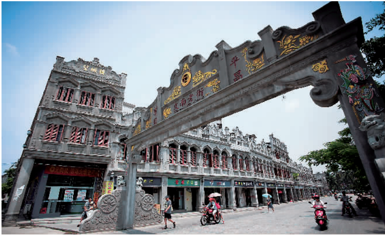
文昌市文南老街经改造,还原了南洋风格建筑形态的原貌。