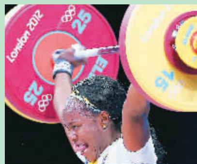
哥伦比亚选手巴洛耶斯赛中吐“舌尖”。