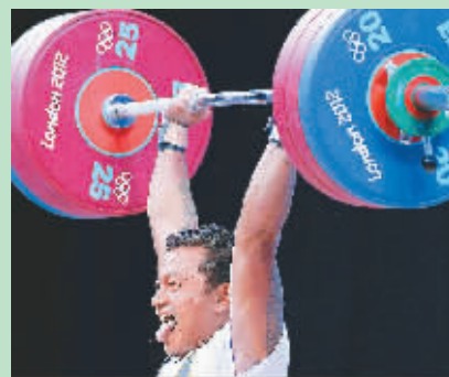
萨摩亚选手在比赛中展示“舌尖”。