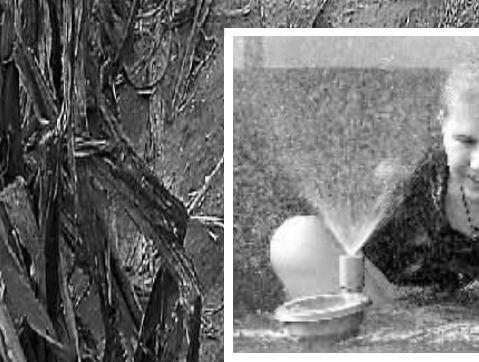
乌克兰高温 8月7日,乌克兰基辅的最高气温当天达到37摄氏度,为1900年以来的最高值。

底图:8月4日,在美国印第安纳州新哈莫尼附近的田地里,严重干旱的玉米地内存活的玉米寥寥无几。半个世纪以来最严重的旱灾正在损害美国的粮食和畜牧业生产,干旱天气已经持续了两个月,美国大陆超过60%的土地正在经历不同程度的干旱。美农业部认为,旱情将影响玉米和大豆生产,有可能推高明年食品价格。受此影响,芝加哥农产品期货市场交投最活跃的12月份玉米合约近期升至每蒲式耳8美元附近,比一个月前高出1美元左右。