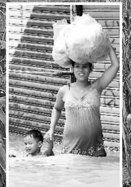
菲律宾暴雨 8月8日,菲律宾首都马尼拉及周边地区遭暴雨袭击,马尼拉多处城区浸泡在水中。

帕赫赫梅尔金少将的职务。包括国防部长扎多宾在内的多名高官受到警告等处分。此外,白俄罗斯外交部近日驳回了瑞典驻白俄罗斯大使埃里克松延期履职的申请。瑞典方面认为这是变相驱逐了自己的大使,欧盟方面也在酝酿对白俄罗斯采取集体应对措施。