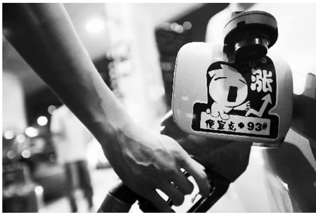
业内人士分析,如果国际原油价格后期持续提振,国内成品油价格9月或迎来再度上调。

国家发展和改革委员会9日宣布,自10日零时起小幅上调汽、柴油价格。这是国内油价在连续三个月下调后首次涨价。为何油价停止下跌步伐?此次上调将对我国经济产生什么影响?国内成品油价格是否又将步入上行通道?后市是否会出现“油荒”?记者采访了相关人士。 国内油价止步“四连跌” 就在人们欢庆国内油价“三连跌”后不久,国际原油价格就展开凌厉的上涨势头。发展改革委表示,此次国内成品油价格调整,主要是按照现行国内成品油价格形成机制,根据近期国际市场油价变化情况决定的。 新华社石油价格系统9日发布的数据显示,8月8日,三地(迪拜、布伦特、辛塔)原油移动平均价格变化率为7.28%。根据现行石油价格管理办法,当国际市场原油连续22个工作日移动平均价格变化超过4%时,可相应调整国内成品油价格。8月9日是7月11日成品油价格调整后第22个工作日。 金银岛成品油市场分析师韩景媛说,“三连跌”后,国内成品油价格累计降幅接近每吨1300元,市场早已囤积上涨动能。此外,当前国内物价压力缓解也是成品油价格如期上调的先决条件。 今年以来,国内成品油价格调整频繁。继2月和3月连续两个月上涨后,5月、6月和7月又连续三个月下调,出现现行价格形成机制实施以来国内油价首个“三连跌”。 韩景媛说,今年以来国内成品油价格严格遵守价格形成机制调整,调整频率明显加快,意味着成品油价格形成机制在实际操作中执行更加严格,并对市场起到一定的积极作用,有助于引导市场根据整体经济形势适当调整,并加快与国际接轨。