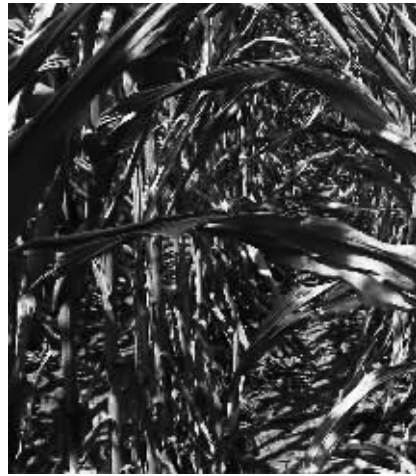
图为美国伊利诺伊州乔治敦附近一处农田因旱灾受损严重的玉米。美国、俄罗斯等产粮大国的旱情,推动国际农产品价格持续走高。8月9日,一项覆盖全球的指数显示7月份粮食价格大幅飙升。

云起 据媒体报道,包括多美滋、美赞臣在内的多个洋奶粉品牌近日再度被曝涨价。这是部分品牌的洋奶粉一年来第4次调价。实际上,近几年来洋奶粉品牌一年多调价已成惯例。外国乳企为何想涨就涨,牢牢吃定中国消费者? 据了解,在欧洲很多国家,普通配方奶粉的价格大多在10欧元左右(折合人民币不到100元)。进口小罐成奶粉增加的成本主要是海关进口关税和检测费,这两项大约占到原价格的近三成。而国内商品的流通成本目前大约在40%左右,但即使将这些费用全部加上,进口奶粉的价格也没有理由翻至两三倍。况且今年国际经济形势不好,大宗商品、石油、包装塑料的价格都在下跌,成本上涨的说法在上两年还说得过去,但是今年洋奶粉的成本上涨理由显然站不住脚。至于有些洋奶粉销售商