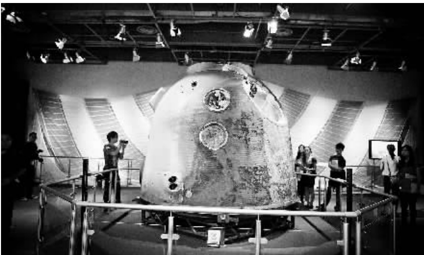
8月12日,由香港特区政府康乐及文化事务署与中国载人航天工程办公室主办的“中国首次载人交会对接航天展”在香港科技馆开幕,展出神舟九号返回舱、航天服以及近百张珍贵照片等。

党的十六大以来的十年,是中国外交应对挑战、成果丰硕的十年。十年间,在科学发展观指导下,中国外交以人为本,维护公民权益,既有暴风骤雨来临时的应对,也有润物细无声的关怀。一次次雪中送炭,一个个务实举措,在中国外交史上留下浓重一笔,也镌刻在每一位公民心里。