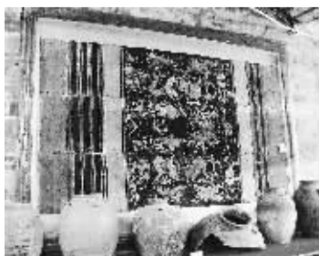
明代织绣龙凤麟祥图龙被。