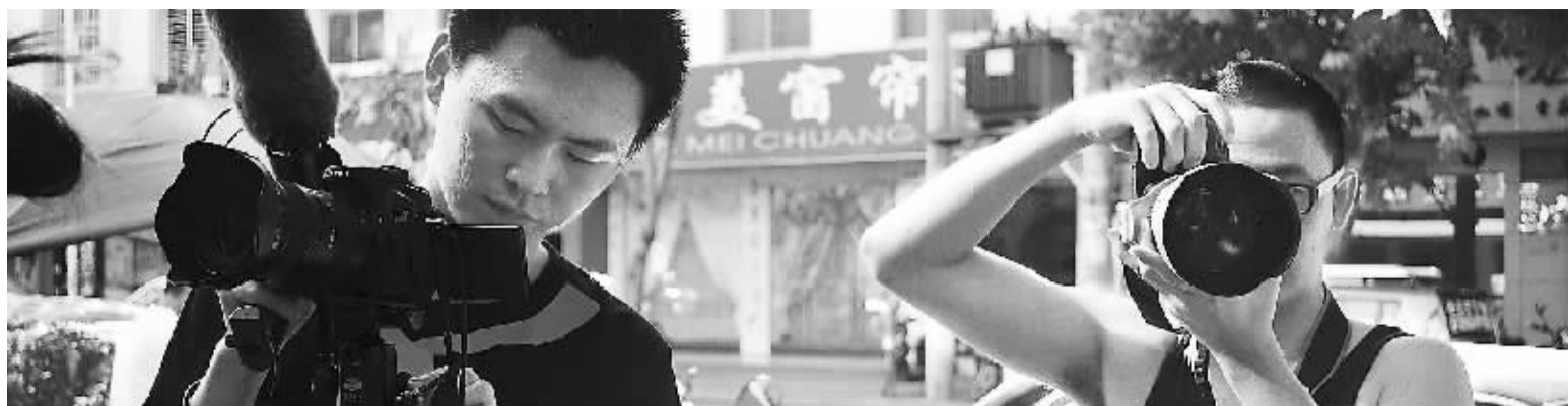
微型纪录片《拾味海南·老爸茶》在行动。