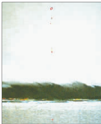
《清水居》(水墨画) 黄孝逵