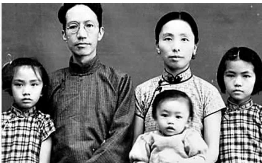
陈寅恪、唐筼夫妇与孩子们在一起。本版图片均为资料图片

1941年12月7日，日军偷袭珍珠港，太平洋战争爆发。同时，日军也向香港发动了进攻，形势异常危急。当时包括陈寅恪在内的一些党政军要人及文化、经济界名流如宋庆龄、何香凝、陈济棠、柳亚子、茅盾、胡政之等都寄居于此，为避免他们落入敌手，重庆政府专门派出飞机到港抢救。但因香港交通断绝，电话不通，无法一一通知被抢救人员，陈寅恪因此错过了返回内地的最佳时机。