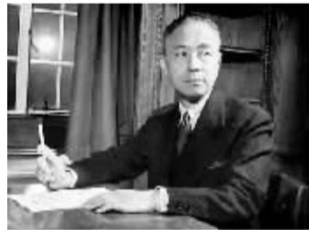
营救陈寅恪脱险的朱家骅。