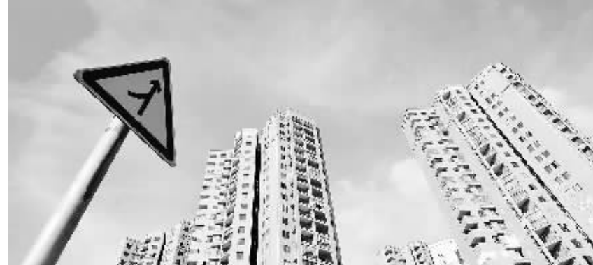
图为长沙市主城区一处新建楼盘(8 月 18 日摄)。

本报讯 国家统计局 18 日公布,在全国 70 个大中城市中,7 月新建商品住宅(不含保障性住房)价格环比下降的城市有 9 个,持平的城市有 11 个,上涨的城市有 50 个,房价上涨的城市数量占比达 71%。北京、上海、广州、深圳等一线城市新建商品住宅价格全部环比上涨。