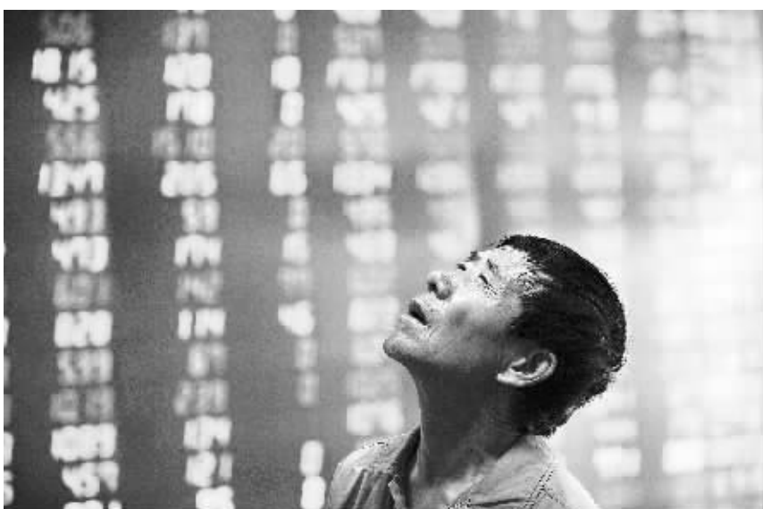
股市跌跌不休,股民难有笑颜。图为 8 月 20 日,股民在沈阳市一证券营业厅关注股市行情。

势,跌幅居前,金科股份跌近 4%。地产股的大跌对指数形成较大的压力。分析人士认为,目前全部 A 股估值水平处于历史底部,甚至已经低于历史上前两次大底的水平,长期看没有理由担心害怕,应逐步乐观起来。尤其是短线技术上股指 30 分钟 K 线下探 BOLL 下轨后走横,60 分钟底背离后有反弹迹象。而日线 J 值进入超卖状态,MACD 始终处于临界死叉但又拒绝死叉的状态。同时周线级别的调整已经持续到了第 16 周,3 年来从未有过,预示股指或出现超跌反弹。