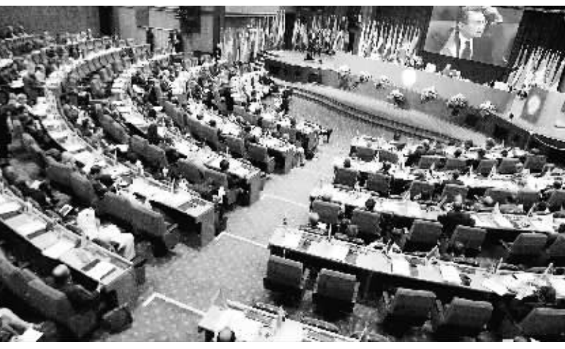
8月26日，与会者在伊朗首都德黑兰出席第16届不结盟运动峰会高官会议。