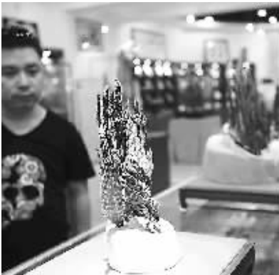
岑香坊陈列的沉香。

关于海南沉香，宋人曾有这样的评价：“占城不若真腊，真腊不若海南黎峒。黎峒又以万安黎母山东峒者，冠绝天下，谓之海南沉，一片万钱。”占城，指今天的越南南部，真腊指柬埔寨。黎峒，指的是海南的琼中、五指山一带。