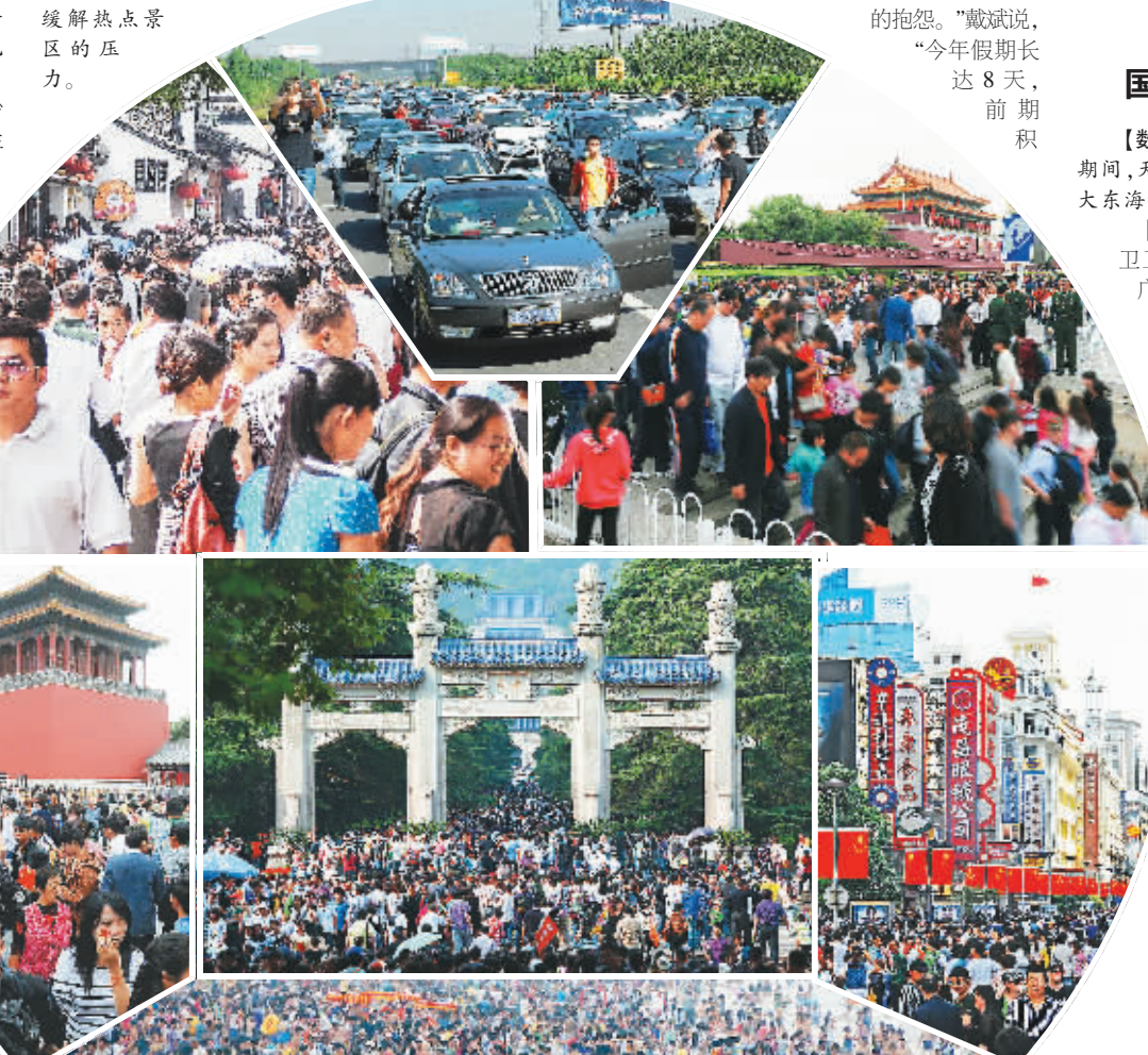
连日,各地景区出现旅游“井喷”现象,甚至有游客惊叹景区“被踩沉”。作为旅游大国,如何促进旅游业的持续健康发展,值得深思。

重要原因之一。因此,驾车出行的车主有必要对照自己的行为进行反思,严格遵守交通法规,不开“霸王车”“赌气车”“抢道车”,同时多点耐心和理解,只有心宽路才会更宽。 在“十二五”期间,我国旅游业处于重要战略机遇期,旅游发展大众化、休闲化的趋势更为明显。经过这个“最长黄金周”的练兵,有关部门只有及时总结经验教训,才能为人们假日出行带来更好的秩序,让“免费通行”政策走得更好。 (新华社北京10月4日电)