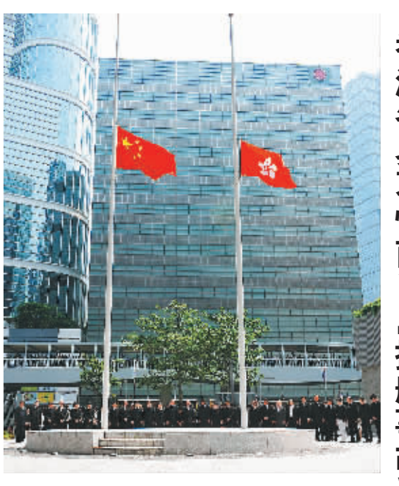
10月4日,香港特别行政区官员在特区政府总部东翼前为南丫岛撞船事故遇难者默哀三分钟。当日是香港为南丫岛撞船事故遇难者设立的全港哀悼日,香港金紫荆广场、特区政府总部、政府各建筑物的国旗及特区政府旗于4日起连续3天下半旗哀悼。

当选十八大代表后,杨守伟依旧重复着每天的护理工作。有同事疑问,你是不是还没有进入状态?杨守伟说,我干好自己的工作,这才是最好的状态。记者张志龙(据新华社济南10月4日电)