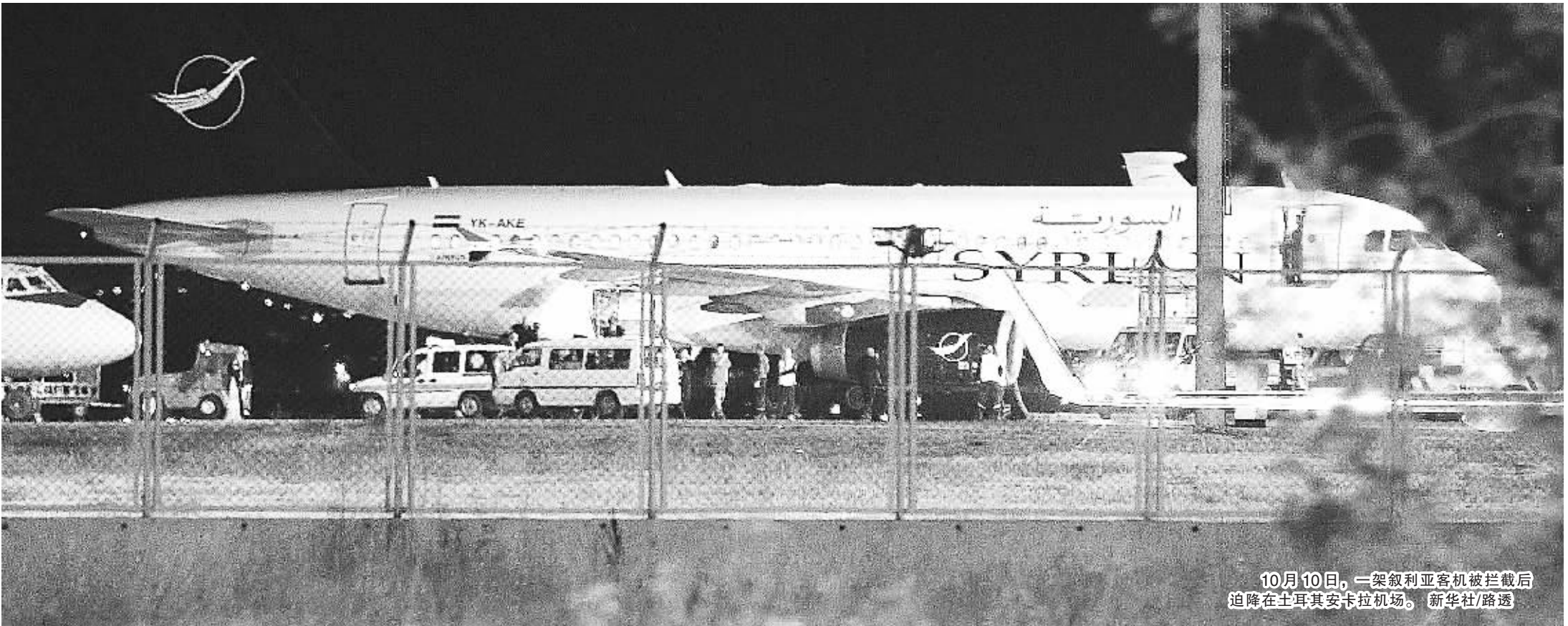
10月10日，一架叙利亚客机被拦截后迫降在土耳其安卡拉机场。