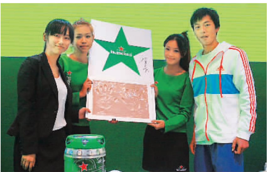
在2012上海网球大师赛期间,中华台北网球高手卢彦勋(右一)和球迷合影。