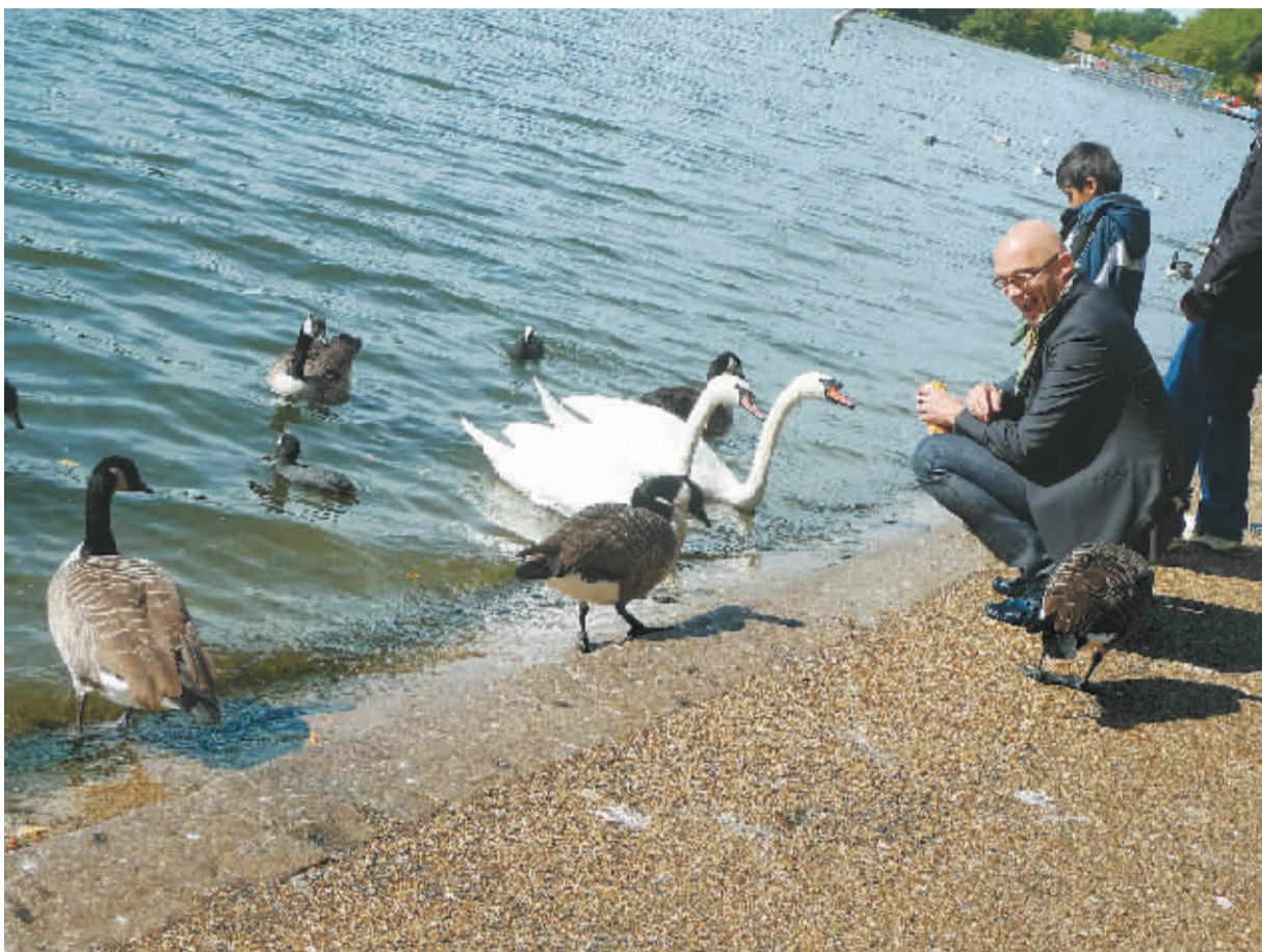
英国伦敦海德公园，人与动物和谐共处。