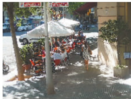
西班牙巴塞罗那随处可见的街头休闲吧。

巴塞罗那的兰布拉步行街是欧洲最为著名的风情街，这里如同一个让游人充分体验当地生活的风情博物馆。在这条长一公里多的步行街上，一年四季游人如织。大街上形态各异的艺人、狂热的球迷、丰盛的花卉和水果市场，以及街道两旁的露天餐厅、咖啡馆，构成了兰布拉步行街美丽而又独特的景致，让游人得以在这里充分体验、感受西班牙的浪漫风情。