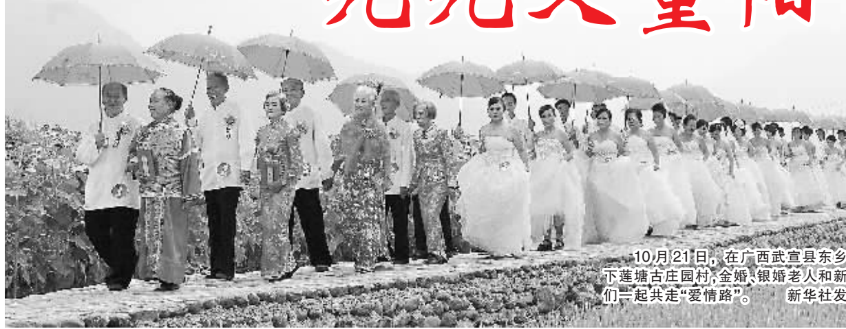
10月21日,在广西武宣县东乡镇下莲塘古庄园村,金婚、银婚老人和新人一起共走“爱情路”。