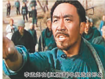
李孟尧在《红旗谱》中塑造的形象

本报讯 北京电影制片厂一级演员李孟尧，于10月19日因病逝世，享年86岁。据介绍，李孟尧早年毕业于北京电影学