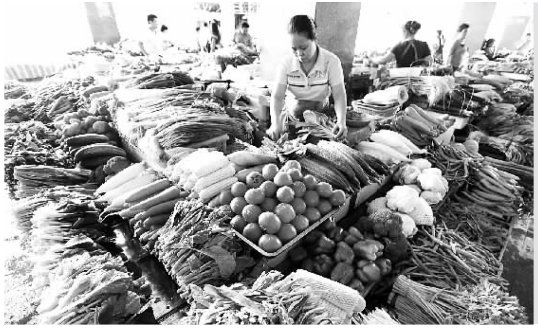
前三季度,我国内需短期呈企稳回升态势,社会消费品零售总额实际增长11.6%,比上年同期提高0.3个百分点。图为10月22日海口某菜市场的摊主正在整理刚送来的蔬菜。

国家统计局日前发布的数据显示,三季度,我国国内生产总值同比增长7.4%,增速比二季度回落0.2个百分点。从单季来看,这已是中国经济连续第七个季度出现增速下降。