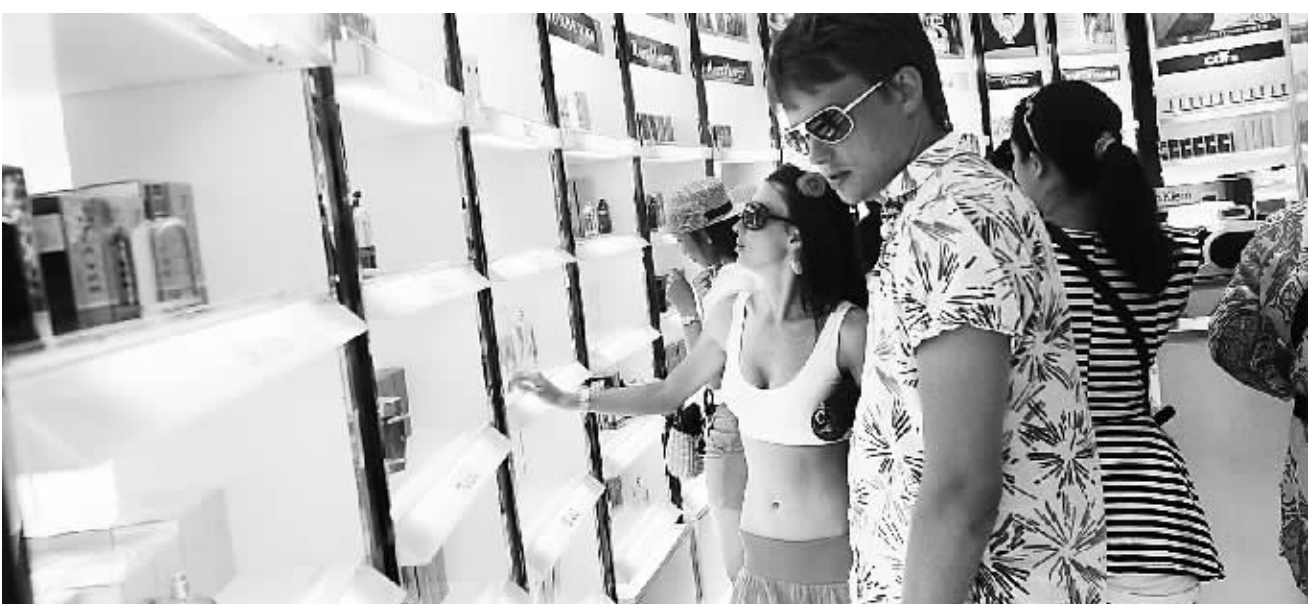
游客在三亚免税店选购商品。

从去年4月20日海南离岛免税政策开始试点实施，到离岛免税政策得到调整完善，备受国人关注的海南离岛免税政策在约一年半的时间里，实现了发展历程中的精彩提升。回首离岛免税政策一年半的实施情况，人们不难发现，这一高含金量的政策带给国人、带给海南的惊喜是实实在在的；国人不出国门便可以购买到各式各样的免税国际名牌商品，自2011年4月20日离岛免税政策实施至今今年9月份，离岛免税累计实现免税销售额26亿元，购物人数126万余人次；海南旅游业转型升级、国际购物中心建设等因离岛免税而加速进程，并显现发展的活力。正因如此，人们有理由相信，这次政策调整带来的明天，应该更美。