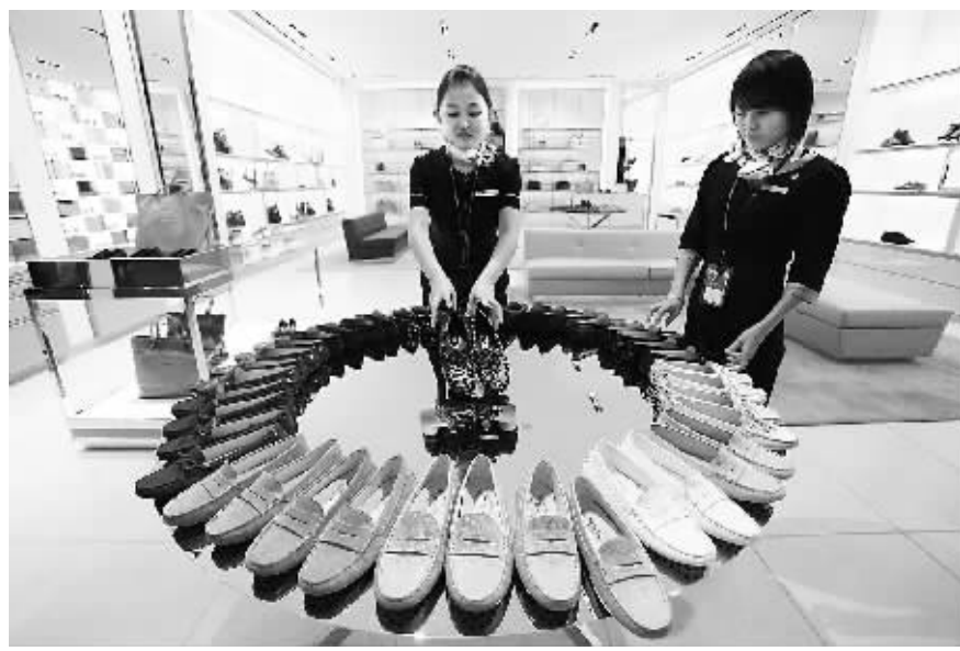
10月24日，海口美兰国际机场的海口免税店，店员在摆整鞋子。

及影响力，目前三亚免税店正在进行店面扩建工作，将在原有营业面积的基础上增加近3700平方米，扩建后三亚免税店营业总面积将达1.07万平方米，将进一步加大顾客接待