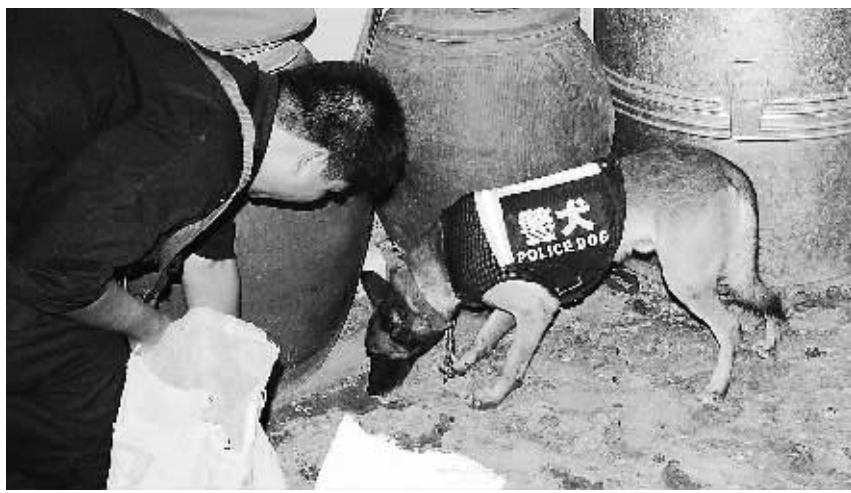
警方在万宁市和乐镇乐群村,对一户涉嫌贩卖毒品的人家进行搜查。

近日的一个中午,万宁和乐镇乐群村,40多名民警、6只警犬,将一处居民楼重重包围,警方接到线索:该户许姓人家在贩卖毒品。 迫于强大威慑,终于有人把门打开,缉毒人员带着警犬一拥而入,迅速将5名涉案人员控制,并在屋里搜获海洛因、冰毒100多克。一个家庭式贩毒窝点就此被警方端掉。 这只是今年以来,万宁警方在和乐镇破获的30宗贩毒案件中一起。近几年,和乐镇毒情较为严峻,今年初还被省禁毒委列为毒品危害重点镇之一,并实行挂牌整治。 一张警民联手布下的天罗地网,在和乐全面铺开。