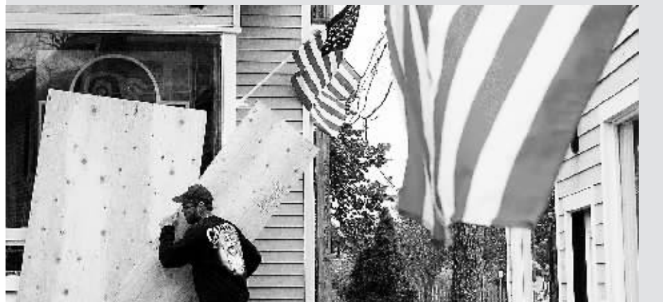
市民用木板加固窗户抵御飓风。