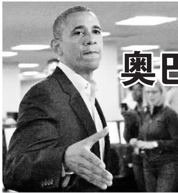
奥巴马在联邦紧急措施署。

中方医疗分队将使用模拟人进行复杂的手术展示。模拟人是中方专门为这次演习研制的复合仿伤员,采用了当今医疗界最为先进的模拟技术,可以模拟伤员确诊的真实状况、真实场景、真实过程。“这些先进技术不仅可以确保演练的顺利进行,而且在以后类似手术训练中也有广泛的应用前景。”徐勤耕说。