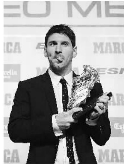
梅西再度捧欧洲金靴。