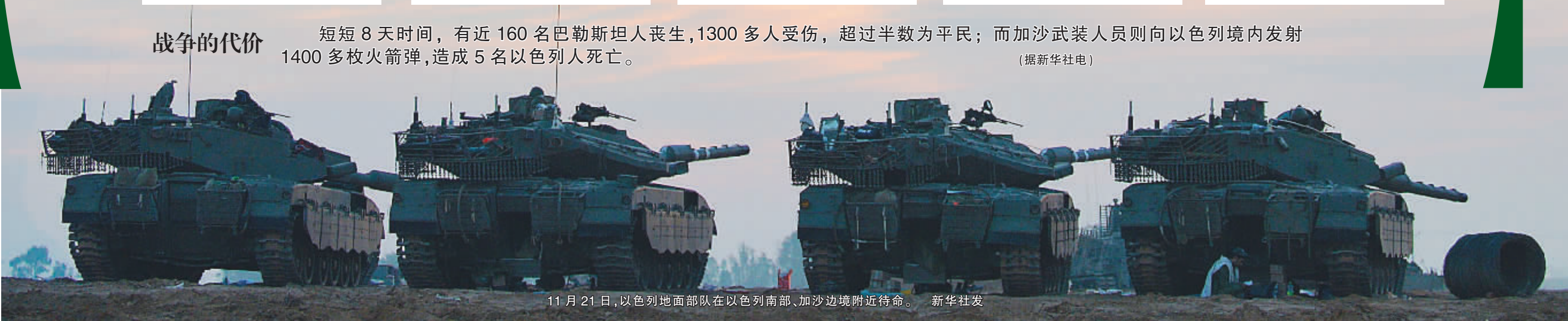
11 月 21 日,以色列地面部队在以色列南部、加沙边境附近待命。