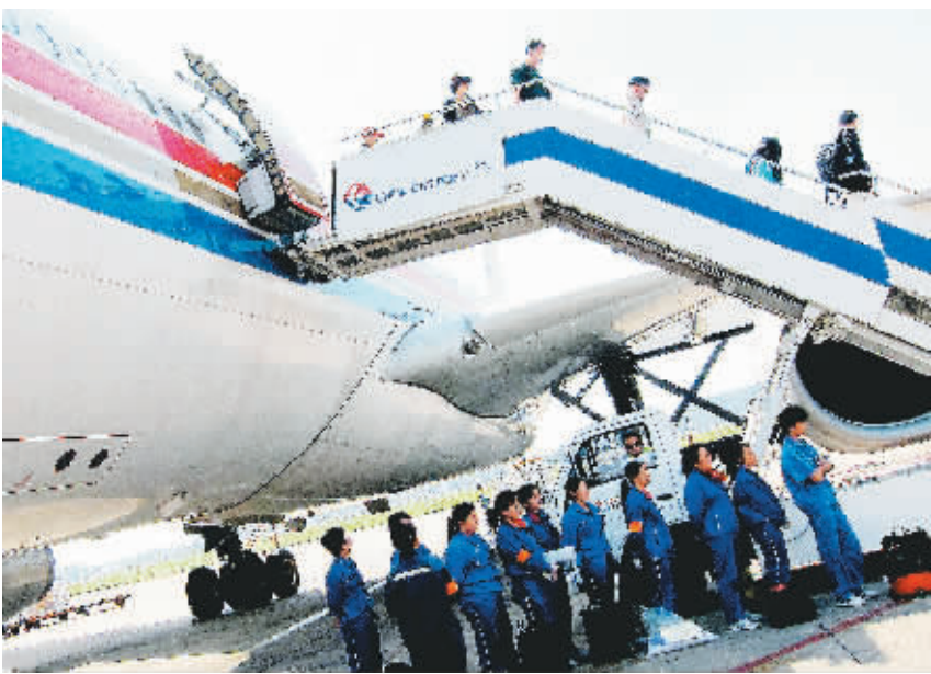
旅客从停靠在上海虹桥国际机场停机坪的一架客机上陆续走出(10月2日摄)。根据国家发展改革委与中国民用航空局相关通知,12月5日起,国内航线燃油附加费征收标准进行调整,具体为销售国内航段(包括国际航线国内段),800公里(含)以下航段每位旅客征收70元,比原来降低10元,800公里以上航段每位旅客征收130元,比原来降低10元。