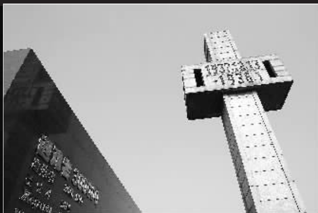
侵华日军南京大屠杀遇难同胞纪念馆在祭场 内的遇难人数和遇难事件的标志碑。