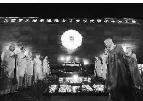
南京毗卢寺僧人为遇难者吟诵经文。