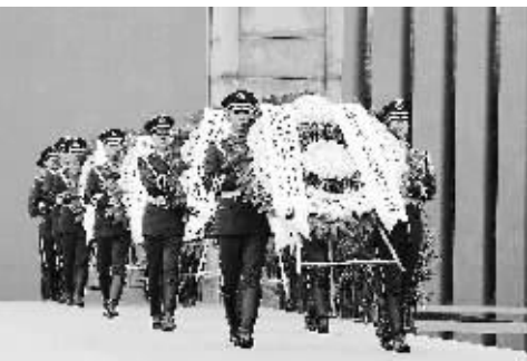
武警战士在国际和平集会上为南京大屠杀 遇难同胞敬献花圈。