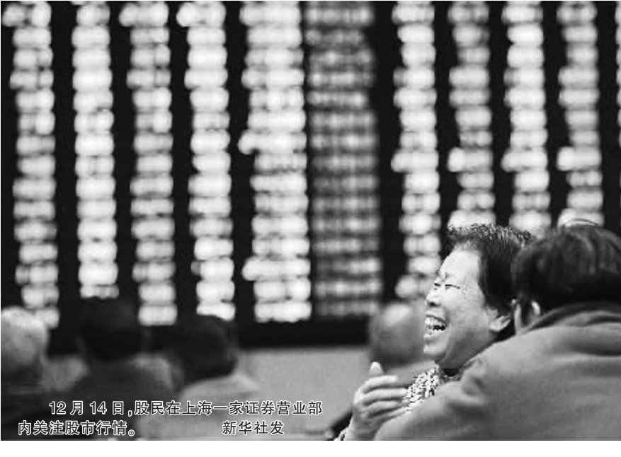
12月14日，股民在上海一家证券营业部南眺股市行情。

4.32% 沪 4.40% 深 两市超50只股票涨停 本报讯 14日沪深股指早盘双双高开，随后券商、保险、银行等板块相继拉升，沪指震荡上行突破五日线后站上2100点大关。之后股指继续上行，市场做多热情全面爆发，临近午盘各板块全线飘红。午后股指持续震荡走高，沪指大涨超4%创2009年10月以来最大单日涨幅，深成指突破六十日线，个股涨停潮涌现，两市超50只股票涨停，金融、地产、有色金属等板块涨幅居前成为绝对的做多主力，市场量能整体放大，两市创下年内第二大成交量。 截至收盘，沪指报2150.63点，上涨89.15点，涨幅4.32%，成交1177.72亿元；深成指报8530.90点，上涨359.55点，涨幅4.40%，成交905.90亿元。本周沪指涨88.84点，涨幅4.31%；深成指涨341.22点，涨幅4.17%；创业板指涨18.73点，涨幅2.94%。 市场人士分析，今日股指大涨的原因有：一是市场普遍乐观预期有利政策出台；二是今日汇丰银行发布的最新数据显示，12月中国制造业采购经理人指数(PMI)初值为50.9，较11月50.5的终值进一步上升，创下14个月以来新高；三是美联储扩大第四轮量化宽松政策；四是证监会简化基金审核制，新基金或可随推推出，助推资金加速入场；五是监管层疏导IPO“堰塞湖”思路明晰，鼓励排队企业向新三板、债券市场分流。(小史)