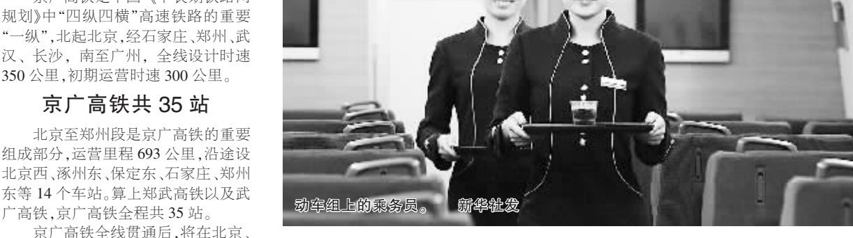
动车组上的乘务员。

据新华社北京12月14日电(记者樊曦)铁道部14日正式公布，随着北京至郑州高铁的开通，世界上运营里程最长的高铁——京广高铁将于12月26日全线打通。北京至广州全长2298公里的距离，以时速300公里计，全程只要8小时左右。 京广高铁是中国《中长期铁路网规划》中“四纵四横”高速铁路的重要组成部分，“一纵”，北起北京，经石家庄、郑州、武汉、长沙、南至广州，全线设计时速350公里，初期运营时速300公里。