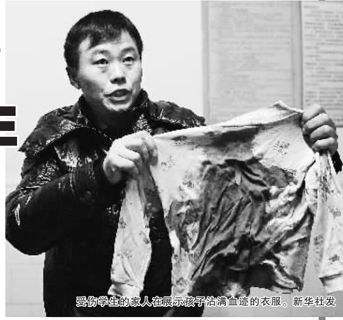
受伤学生的家人在展示孩子沾满血迹的衣服。

“河南光山县14日发生的小校园事件中,22名小学生被砍伤,1名老人命在旦夕。在发出这一消息后,光山县当地封锁消息,官方集体失声,甚至有当地干部在办私事、玩游戏,称“探讨没意义”。面对在外地打工匆匆赶回的死伤学生的家长,人们追问:如何给留守儿童一个安全校园?”