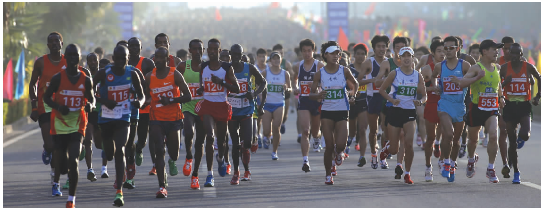
儋州马拉松三年三级跳