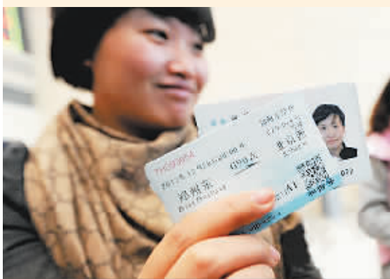
12月20日,一位顾客在郑州东站买到了售出的第一张郑州至北京的高铁票。

新华网北京12月20日电 京广高铁各次列车于今日上午10点开始发售车票。旅客可通过互联网购票、电话订票、铁路客票代售处及车站售票窗口、自助售票机等多种方式购买12月26日至12月31日的车票。