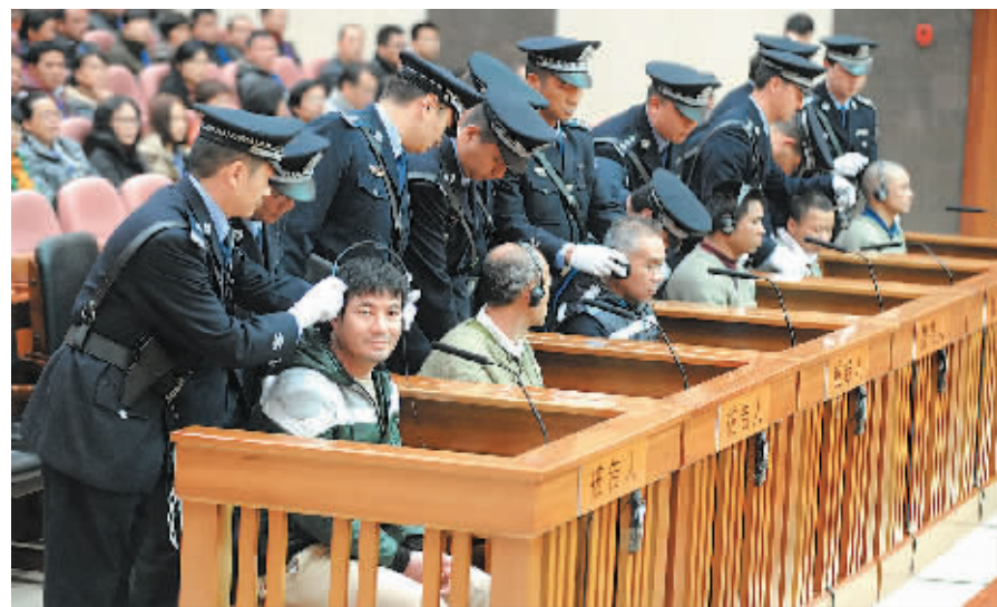
12月20日拍摄的庭审现场。新华社记者 秦晴 摄

新华社昆明12月20日电(记者王研)20日9时,云南省高级人民法院对湄公河中国船员遇害一案进行二审公开开庭审理。上诉人糯康及其委托辩护人,桑康、乍萨及其委托辩护人,依莱、扎西卡、扎波、扎拖波及其指定辩护人到庭参加诉讼,云南省人民检察院4名检察员出庭履行职务。