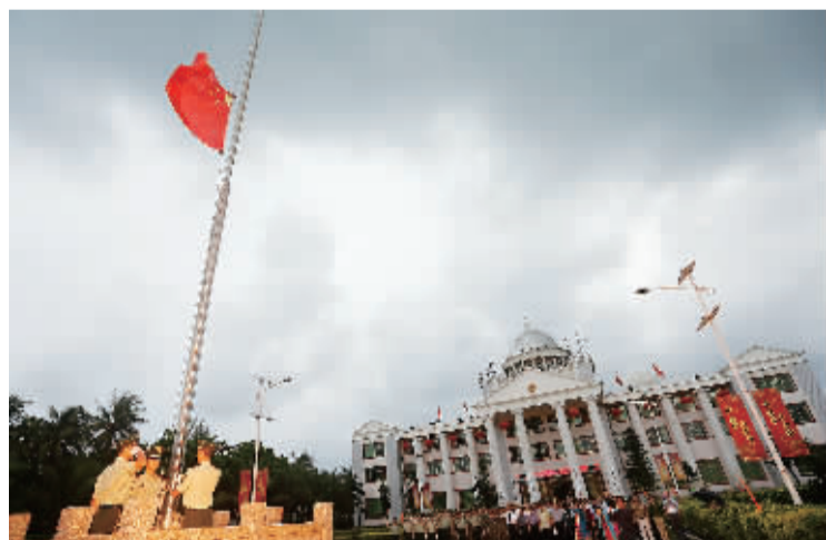
七月二十四日清晨,三沙军民参加升旗仪式。

作为值守三沙气象台的副台长,符祥震已在这里工作了10年。1974年西沙海战后,国家在珊瑚岛设立了气象站,每10个月要轮换气象员去岛上值班。