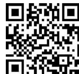
扫一扫二维码访问无线城市获取更多三沙资讯

这是建立在自然环境恶劣、物资短缺等实际困难基础上的成就。新生的三沙市,人手少,工作量大,任务繁重,各部门都是“白加黑”、“五加二”。一人多岗、一岗多职现象普遍存在。所有人都不得不放弃休息,全身心投入到工作中去。