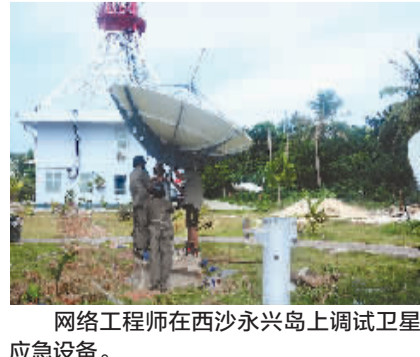
网络工程师在西沙永兴岛上调试卫星应急设备。