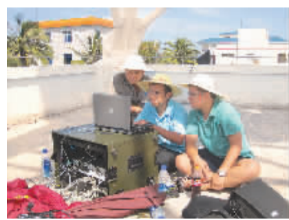
网络优化师为修复西沙中断海缆监测有关卫星设备数据。