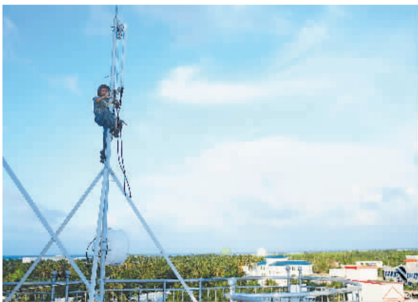
网络工程师顶着烈日在西沙永兴岛电视台基站上安装天线。

通信网络服务,并历时十余年,累计投资数千万元,克服地理环境、气象环境对移动通信覆盖的影响,实现了在南海环海南岛70公里广域覆盖,西沙群岛连续覆盖和南沙海域7个岛礁全覆盖,网络指标处于国际领先地位,为我国南海海防及海上权益保护起到了积极的保障作用。