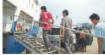
“十八大”期间,网络建维团队登上“琼沙三号”赴西沙作通信保障。