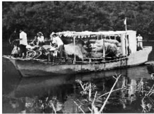
大广坝库区移民当年迁出时的情景。