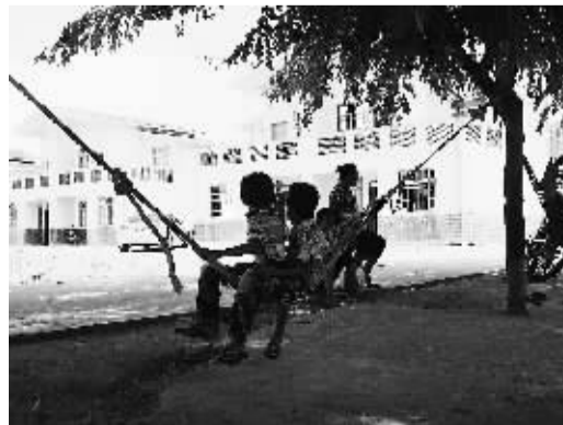
7月31日,库区移民村——东方市东河镇佳头村,村民在新居前纳凉。