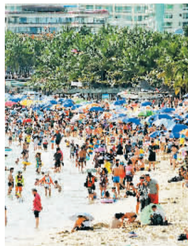
三亚海滩常常挤满游客。

溺水后懂得自救也非常重要。不会游泳的游客应头顶向后, 口向上方, 将口鼻露出水面呼吸, 千万不能将手举或拼命挣扎, 这样反而容易使人下沉。会游泳者溺水时应将身体抱成一团, 如果手腕抽筋, 可将手指上下屈伸, 采取仰面位, 用两足划水。(本报三亚8月5日电)