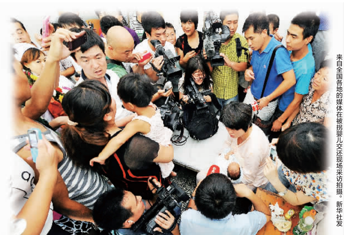
来自全国各地的媒体在被拐婴儿交还现场采访拍摄。

洋医疗设备进入中国后的售价一般是在本土售价的3-5倍。这一方面导致医疗器械设备价格居高不下,同时也加剧了“看病贵”的矛盾。图为医务人员正在进口医疗器械上观察病情(资料照片)。