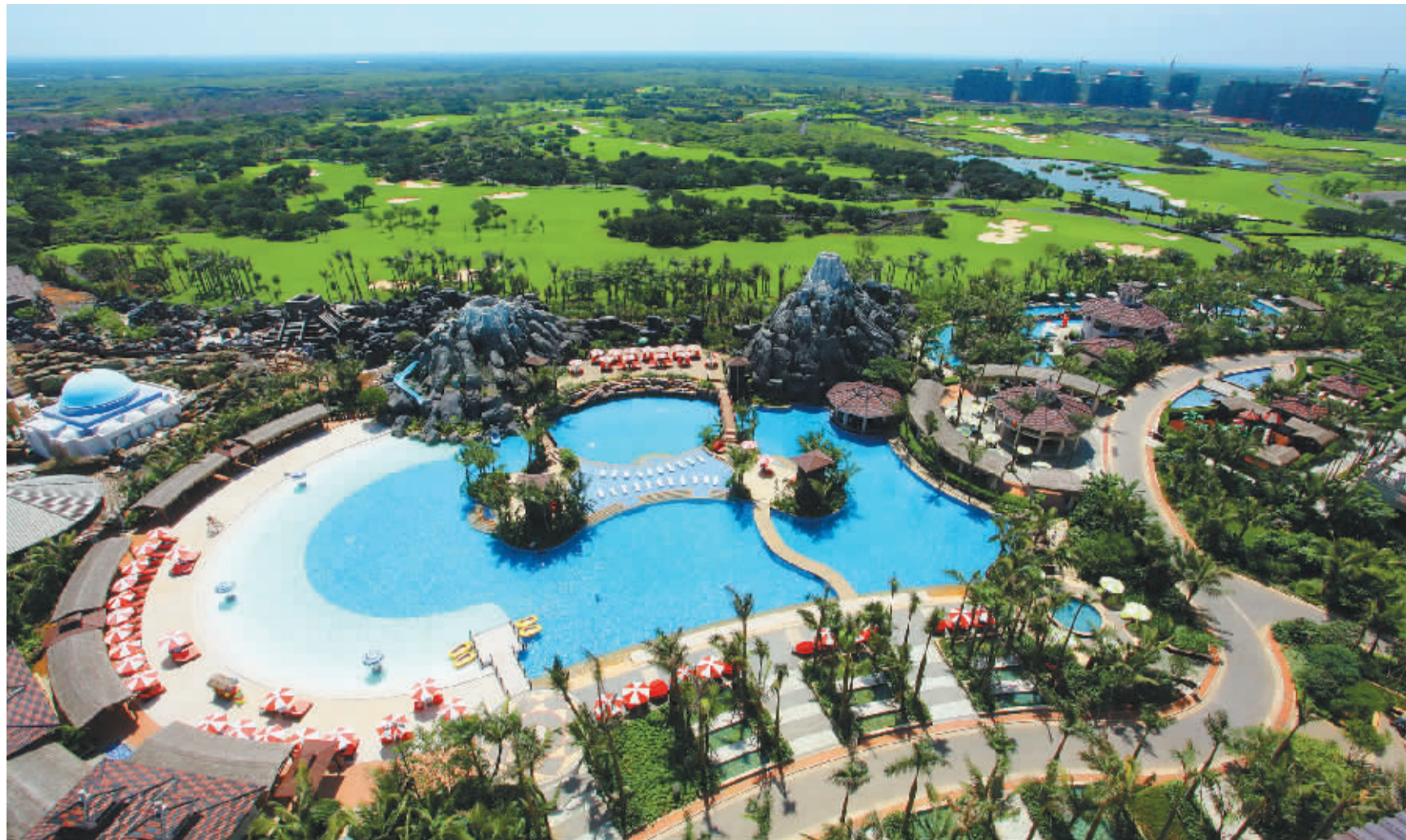
海南高端度假酒店期待转型。