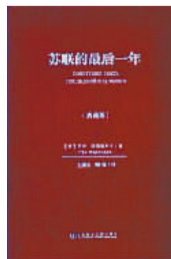
社科文献出版社 2013年7月

本书是作者近年来研究中国经济变革史的集大成之作,对中国历史上十数次重大经济变革的种种措施和实践作了系统的概述和比照,指明因革演变,坦陈利害得失,既高屋建瓴地总括了中国改革的历史脉络,又剖析了隐藏在历代经济变革中的内在逻辑与规律。辨得失,以史为鉴,实不失为一部简明的“中国经济史”。