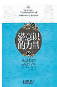
中国城市出版社 2013年7月

本书由俄罗斯著名史学家、政论家罗伊·麦德维杰夫撰写,主要讲述1991年“8·19”事件前后苏联的经济状况、人民群众的情绪、党的领导层的变动、事件过程中的一些关键节点、重要人物,以及作者本人对这一事件的总结和反思。作为史学家,麦德维杰夫在苏联解体十年后痛定思痛,根据史料和事实,对苏联解体的原因进行了深层的分析。对于中国读者了解这段历史,汲取苏联解体教训具有借鉴和启发意义。