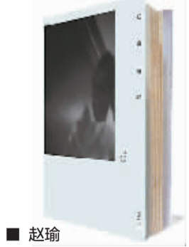
王安忆著 上海文艺出版社 2013年1月