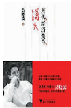
浙江大学出版社 2013年7月