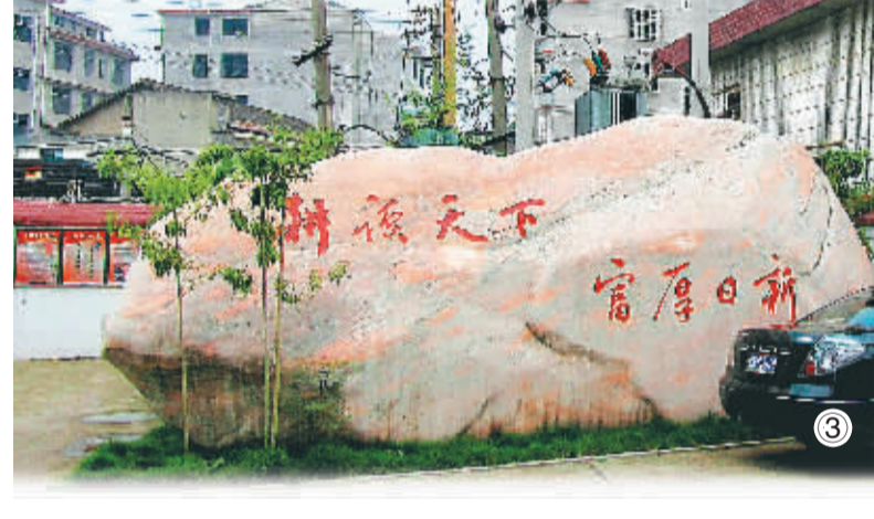
图3 倚着院墙、冲着大门的巨石

可。石商们说，“黄金有价石无价”，高档奇石、石雕等的价格，主观、随机且无法比较。如是单位公款采购，经办人可“神不知鬼不觉”捞一笔，如是送礼，赠送方不仅可加深“人脉”，更可虚增经营成本避税，有“洗钱”功效。