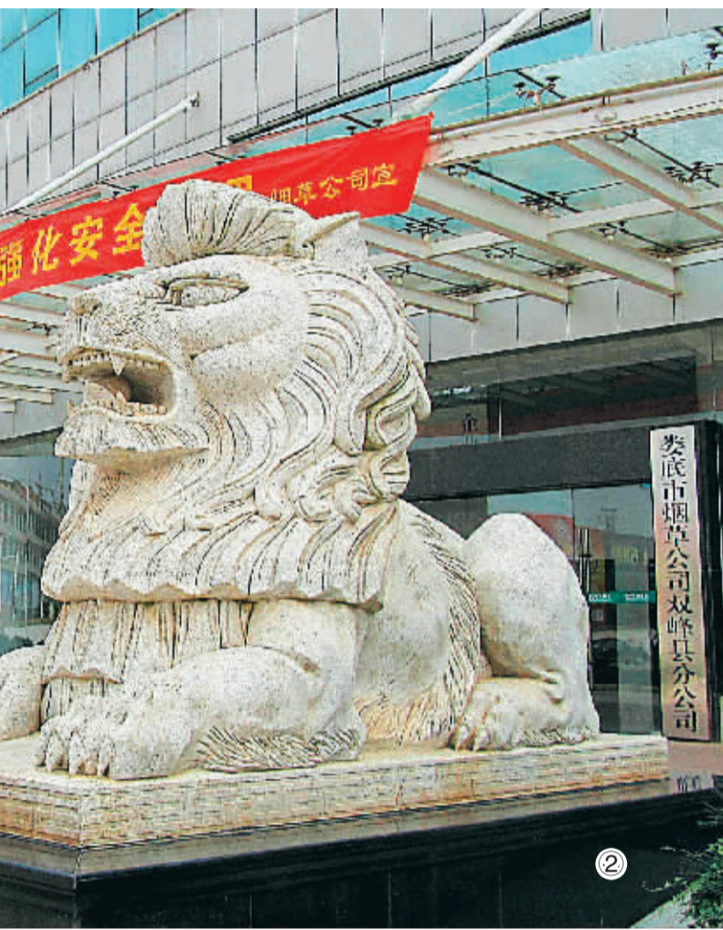
图2 烟草公司门前的一对怒目圆睁的大狮子

通过石材市场，记者还了解到一些单位热衷此类采购的另一种玄机。很多商人经营奇石、瑞兽生意，但对其销售对象严格保密。一位石商指着一块重达几十吨、形态怪异的巨石说，此石实价60万元左右，但发票可以开100万元。还有的石商则表示，票开多大金额都行，只需支付票面金额的6.9%缴税即