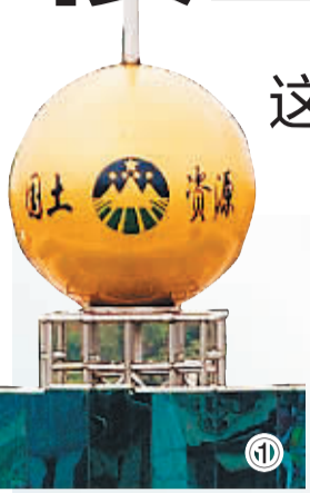
图1 国土资源局办公大楼上的“风水球”

“转运石”，则是近年来党政机关异军突起的新玩物。在刚落成供党政机关使用的新北方一座中心城市“民生大厦”，大楼一侧矗立着一块巨型“太湖石”。在山西一个国家级贫困县，记者刚听完当地住建局局长诉苦“财政困难，再不交电费县城路灯今明两天马上就要熄灭”，转身却在县委大院见到一块价值不菲、刻着“和谐某县”的巨石。在河南、山西等省份，一些党政机构门前门外巨石造型奇特，有的甚至用重达几十、上百吨的整块巨石做“照壁”，还有的用大量泰山石等石材造假山。按照一些“业内人士”的说法，自然形成的各种奇石，“聚天地之灵