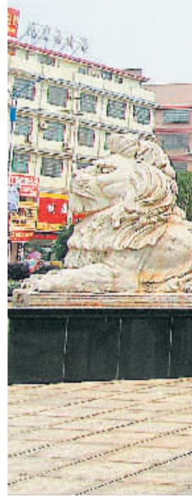
图2 烟草公司门前的一对怒目圆睁的大狮子