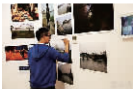
威尼斯双年展中国平行展一角。

正在威尼斯热展的第55届威尼斯双年展因为强大的中国军团进驻而成为今年艺术界的热点话题。本次双年展共有250个展览,其中120个国家馆,还有诸多中国外国展或称平行展。2013年在威尼斯双年展独立策展人项目(平行展)的中国艺术家,占到世界全部参展艺术家的半数以上,据报道共有2000多名中国艺术家参与双年展期间的各类活动,中国艺术家扎堆威尼斯双年展在国内引发了各种议论。那么,威尼斯双年展到底是一个怎么样的展览?应该给它怎样中肯的评价?本刊特约撰稿李国华先生给出他的观感,道出中国艺术家的威尼斯情结。