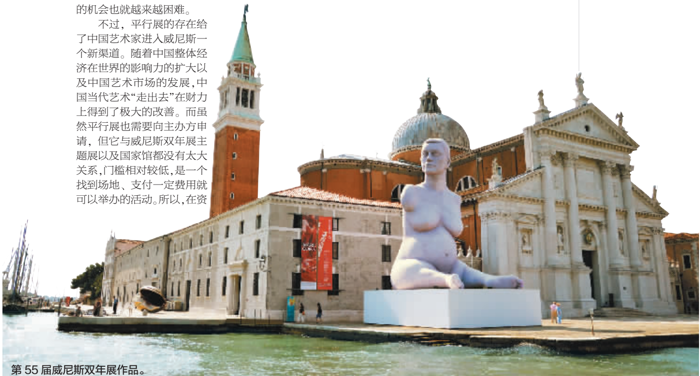
第55届威尼斯双年展作品。