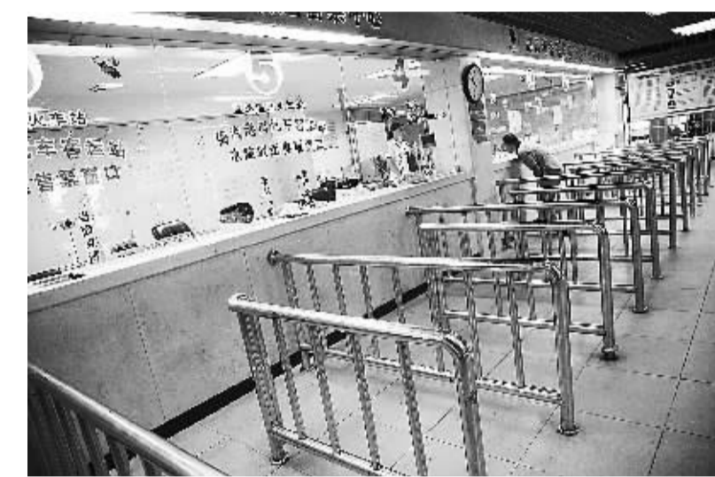
8月14日,受强台风“尤特”影响,琼州海峡全线停航,图为海口市秀英港空荡荡的售票大厅。

“虽然此次‘尤特’未在海南登陆,但我省提前预警,重在防范,尽最大努力减少台风灾害损失,力保人民群众生命财产安全。”省“三防”办负责人表示。