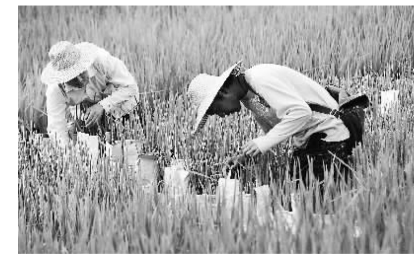
产量保险对农民种植风险保障度更高。