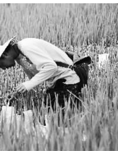
产量保险对农民种植风险保障度更高。