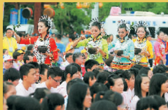
美丽的七仙女将圣水洒向参加开幕式的宾客。