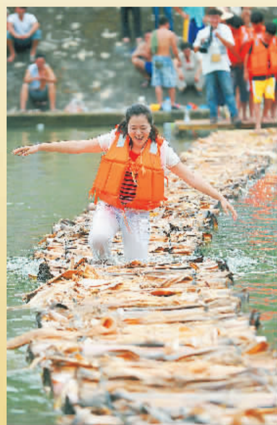
七仙河上的“过浮桥”趣味比赛。