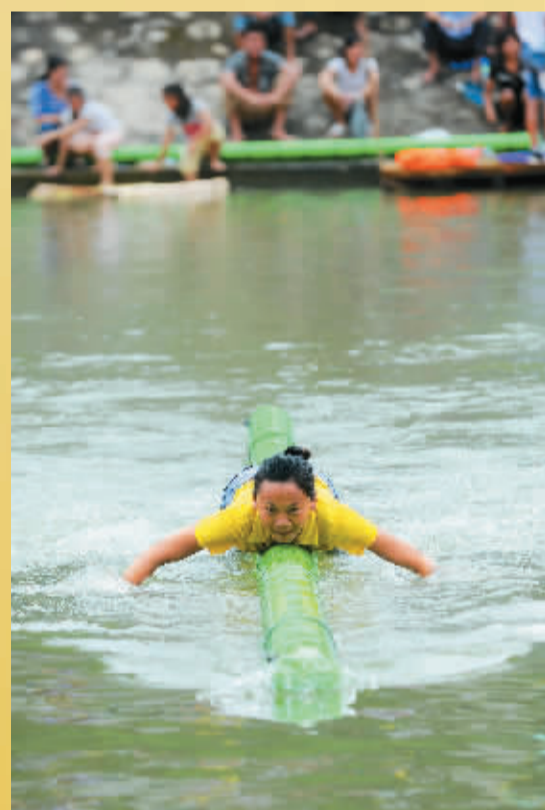
高难度的水上“独竹漂”。