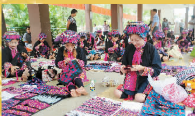
8月14日,保亭黎族织锦、苗族染绣技艺比赛在七仙广场举行,数百名来自各乡镇的妇女儿童、包括几名男选手参加比赛。