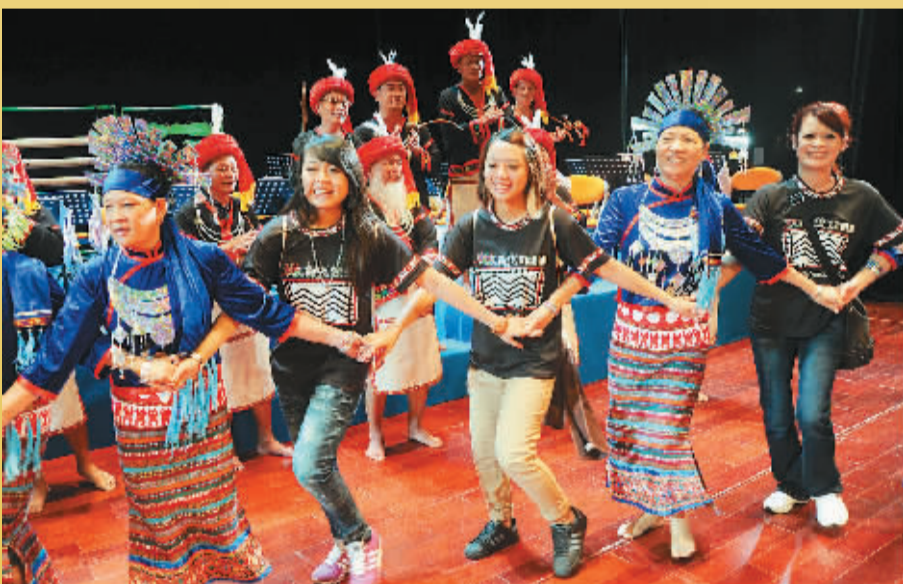
8月12日,台湾少数民族代表团来到保亭访问,与当地“原色保亭”民族乐队成员们一起高唱《我们都是一家人》,跳起了欢快的舞蹈。