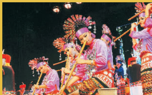
原色保亭黎族音乐歌舞晚会让大家认识了许多独特的民族乐器。