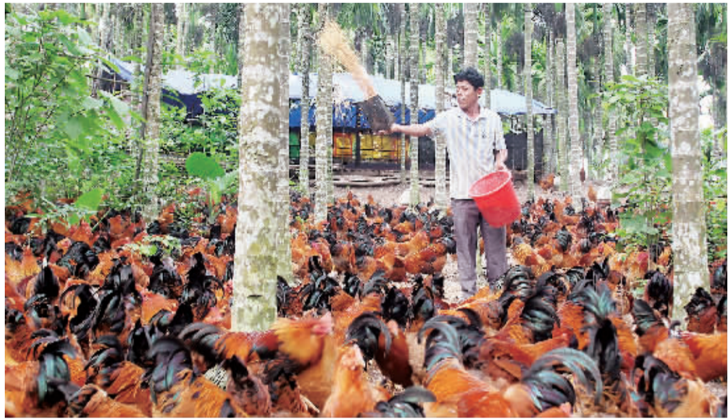
屯昌县屯城镇茶山外村屯昌阉鸡养殖示范基地辐射带动周边乡镇3000户养殖户共同饲养阉鸡。图为基地农户在给鸡喂食。本报记者 武威 摄

又拄拐杆”,稳赚不赔。据了解,屯昌县屯城镇茶山外村共养殖10万只阉鸡。“这几年养鸡赚钱,全村90%以上的村民家养鸡,多则5000只,少则200只。我家的阉鸡原先是200多只,现在增加到约2000只。”陈天雄说。