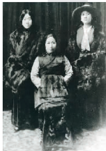
宋霭龄(后左)、宋庆龄和母亲合影