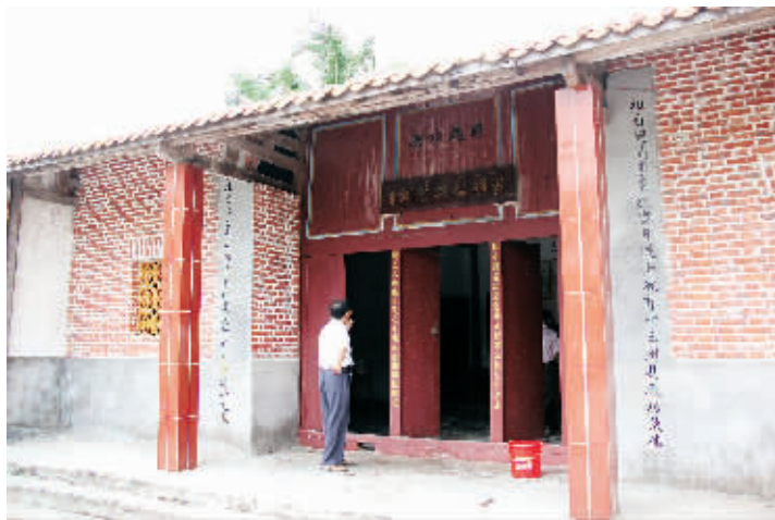
东方市四更镇赤坎村的「符确公兴贤祠」。