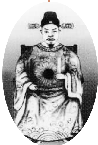
苏轼的学生、进士符确像。

琼州符氏的5位渡琼祖中，有4位源自同一先祖——中唐名将——符璘。符璘忠于唐朝，骁勇善战，多次平乱，被封为“义阳郡王”，其后代引以为荣，因此大都以“义阳”作为堂号，即使侨居异国，也仍沿用。