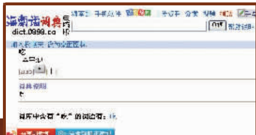
海南酷软件包含了海南话词典,简单好用,功能强大